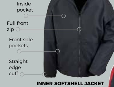
INNER SOFTSHELL JACKET

R400M&F FABRIC OUTER: WATERPROOF 3000mm, BREATHABLE 3000g, WINDPROOF INNER: SHOWERPROOF, WINDPROOF LINING: 100% Polyester INNER JKT: 280g/m 2 100% Polyester 2-layer soft shell OUTER JKT: 100% Polyester ripstop