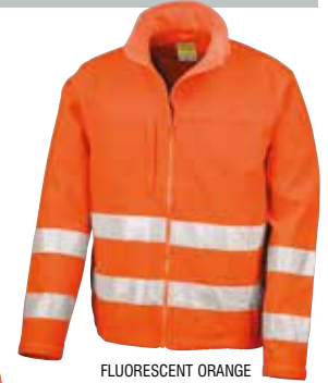
FLUORESCENT ORANGE (811)