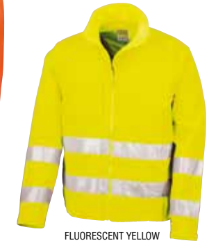
FLUORESCENT YELLOW (394)