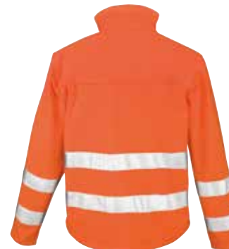
Fashionable shaped longer back panel