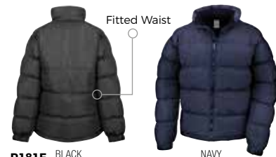
R181F BLACK (BLK)